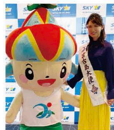
▲スカイマーク就航記念式典でみーやくんとツーショット

たいです。それにしても、宮古は本当に面白いところですよ。過去には平家の落人伝説があったり、未来に目を向けると宇宙港の構想があったり。色々な人がいて、色々な「ストーリー」が詰まっています。この宮古を子どもたちにも残していけるように、一人ひとりが立ち立ちように、島のためにできることを考えていけたら素晴らしいですね。