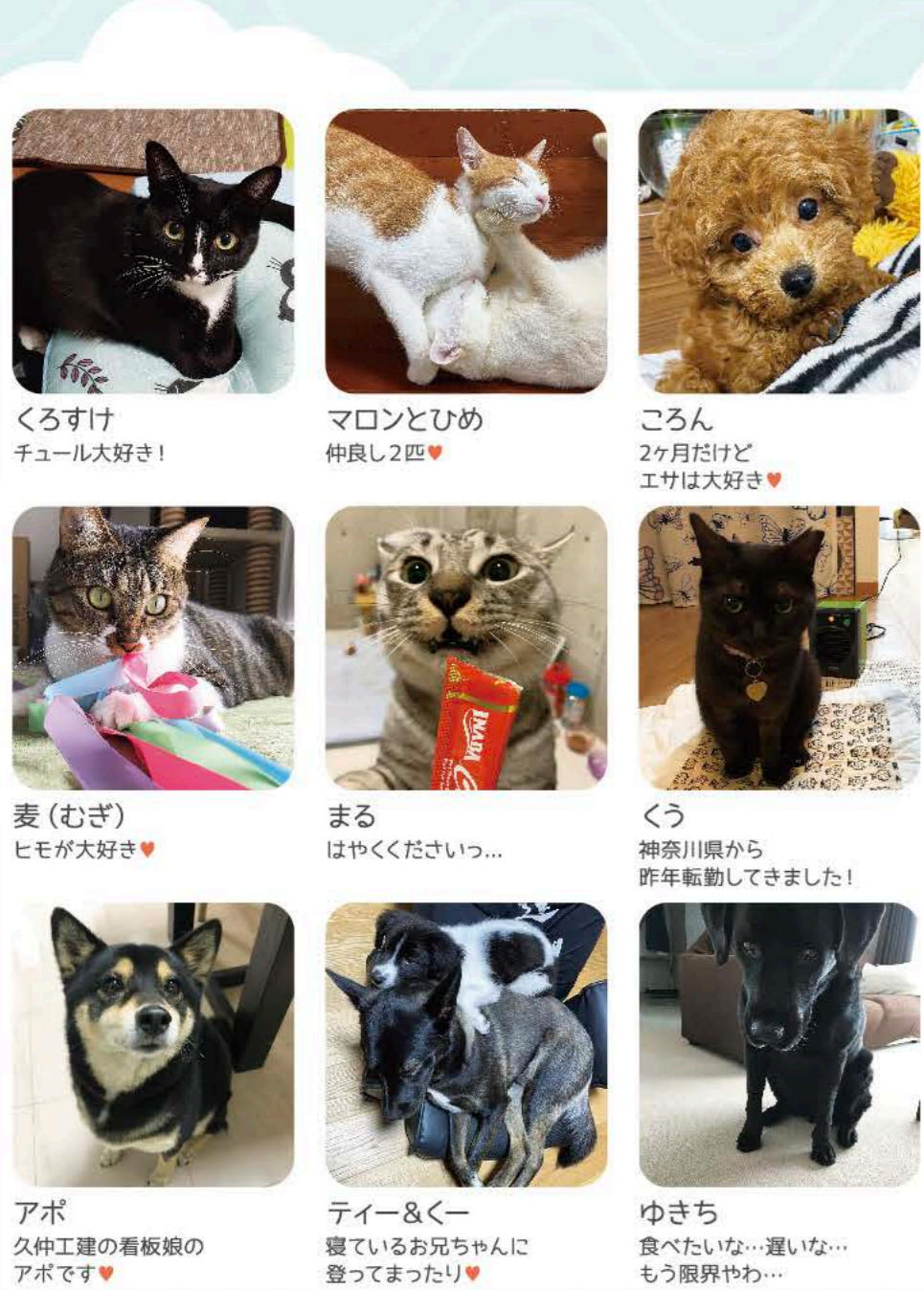
くろすけ チュール大好き! マロンとひめ 仲良し2匹♥ ころん 2ヶ月だけど 工材は大好き♥ 麦(むぎ) ヒモが大好き♥ まる はやくください... くう 神奈川県から 昨年転動してきました! あずき 故:おもちちゃんと 仲良くお昼寝 ラテ ずっと一緒にいようね^_^ くーちゃん 隠れてケーキたべたのに... アポ 久仲工建の看板娘の アポです♥ ティ&くー 寝ているお兄ちゃんに 登ってまったり♥ ゆきち 食べたいな...遅いな... もう限界やわ... 官兵衛(かんべえ) 清水エスパルスの応援が 得意です! てんてん 初めてキャットタワーに 登ったよ! クーちゃん 宮古は暑〜いよー!