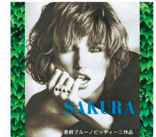
▲世界認定 オーガニックライセンス サロン

宮古島初上陸!! 業界初!! 酵素+オーガニック+アールペーダー 一生美しい髪と共に過ごせるように。酵素美容は、老化の原因となる活性酸素や糖化を抑え免疫力を高める施術です。完全プライベート・ご予約制