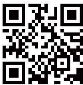
笑いヨガを動画でチェック！ 日本笑いヨガ協会公式動画

笑いとお腹呼吸を組み合わせた健康体操のこと。面白いことを言って笑い合うのではなく、グループで手拍子や掛け声とともに体を動かし「笑う」を行なう。笑いには体内ジョギングとも言え、30秒間声を出して笑うだけで血流量が増加し、脳が活性化するんだそう！