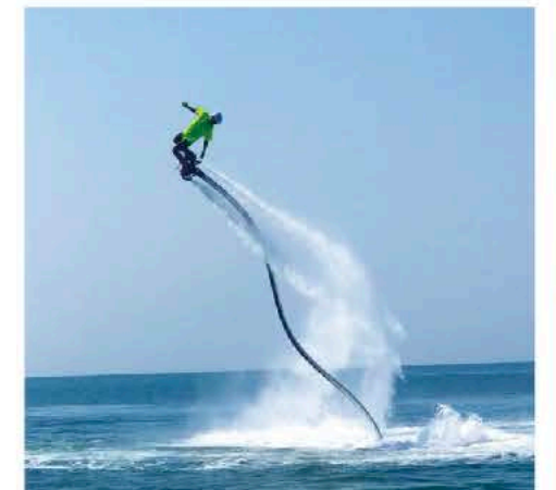
注目度NO.1!! 初めの方も宮古ブルーの上を空中散歩♪

話題沸騰中のフライボード!! 美しい宮古島の海で優雅に空中散歩を楽しみませんか? マリッジジェットから噴出される強力な水圧を利用して空を飛ぶ新たなアクティビティ「フライボード」 初めての方もB.BLUEスタッフが安心安全にレクチャーしてくれます♪宮古島の夏の思い出を作りましょう☆