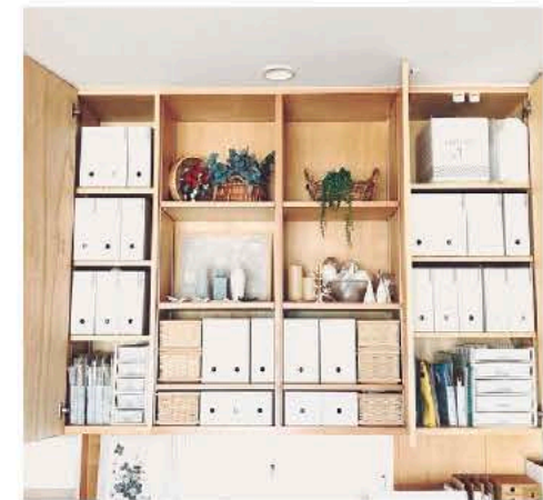
▲お片付けを身につけて私らしく暮らす

【9月限定ステイホーム応援企画】 無料! お片付けオンライン相談会 おうちのお片付け法をオンラインでアドバイス。快適なおうちでステイホームが好きな方も?! 年末の大掃除も楽になりますよ!