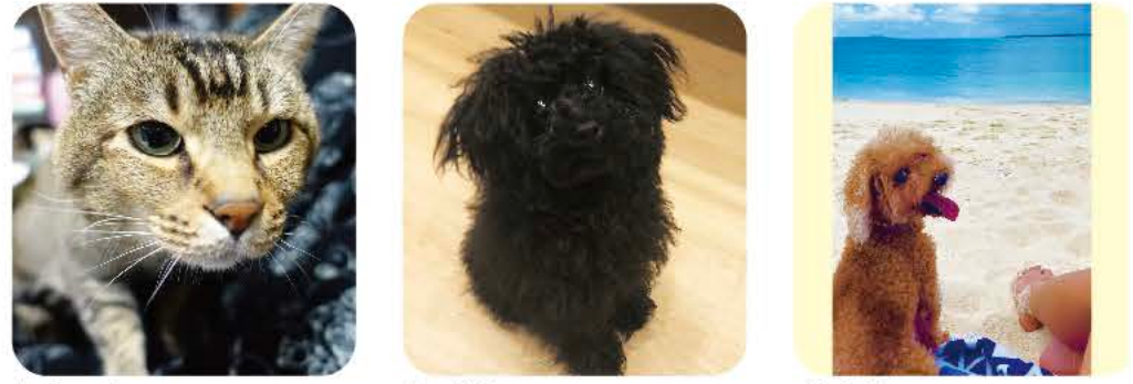
ししやも 甘えん坊♡ もずく もずくかわいすぎ♡ 虎之助 宮古の海が大好きです♡