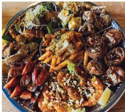
▲ごきげんオードブル 4,000円(3、4人前) ¥6,000円(5、6人前)

下里 ごきげんコスミ飯! お家でも楽しめちゃいます! 公式LINEで、いつでもどこでも注文!