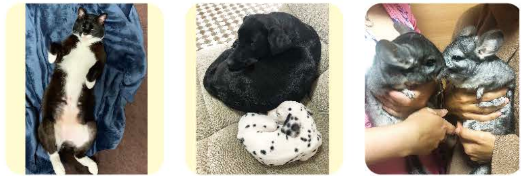
しゅうまい 好きなことは食べることに 関すること！ もずく、カフー ダルメシアンのカフーは もずくが大好き♡ パニラ、うさび 最近生まれたパニラと お兄ちゃんのうさび♡