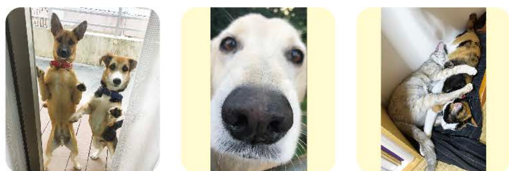
ボン、ペペ 散歩まだー？ ダニーマッコイ あと15年は生きます★ ピビ、ナミ これからも癒やしをください♡