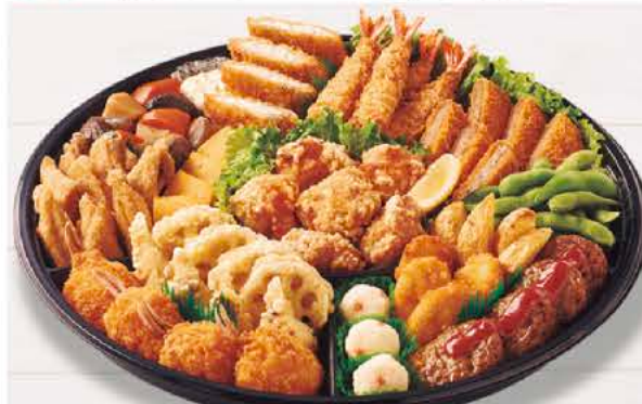
▲4~5名様向けオードブル 3,000円 要予約3日前まで

西里松原 旧十六日祭、卒業、入学、お祝いの席を 彩るオードブル! ご予約承り中!