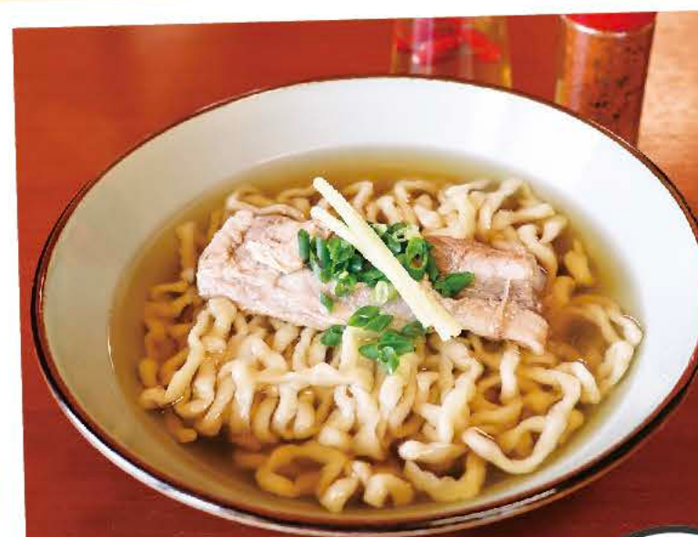
なんこつそば(中) ちぢれ麺 700円