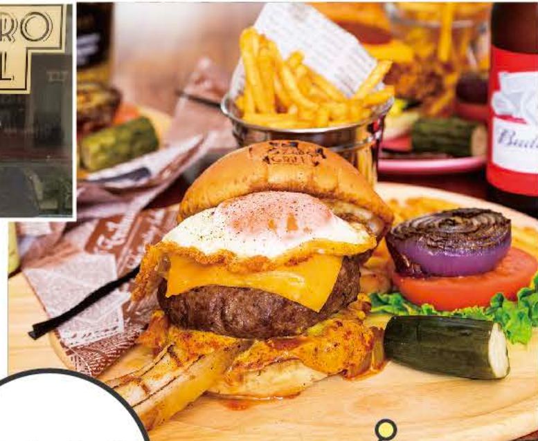
MOCCHAN'S BURGER 1,580円