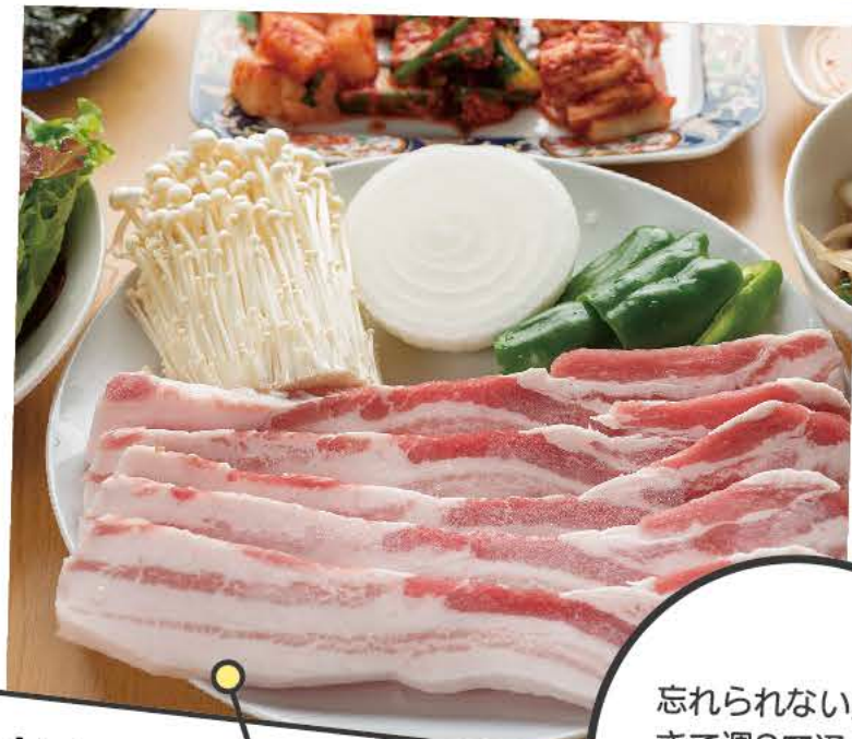
サムギョプサルセット (2人前) 2,980円